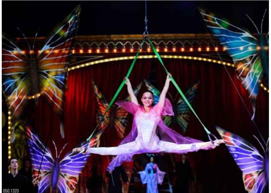
Eine artistische Einlage aus dem aktuellen Programm.