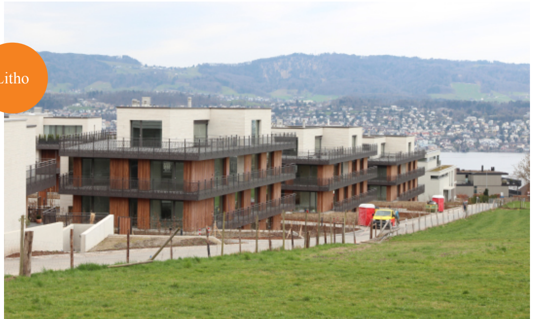
Komfortables Wohnen an der Lerchenbergstrasse in Erlenbach mit Blick auf den Zürichsee.

E rlenbach liegt nur gerade fünf Kilometer ausserhalb der boomenden Stadt Zürich auf der sonnigen, «Goldküste» genannten Uferseite des Zürichsees, bietet ruhige Wohnlagen und einen Steuerfuss von weniger als 80 Prozent. So versteht es sich von selbst, dass freier Wohnraum hier gleichermaßen rar wie teuer ist.